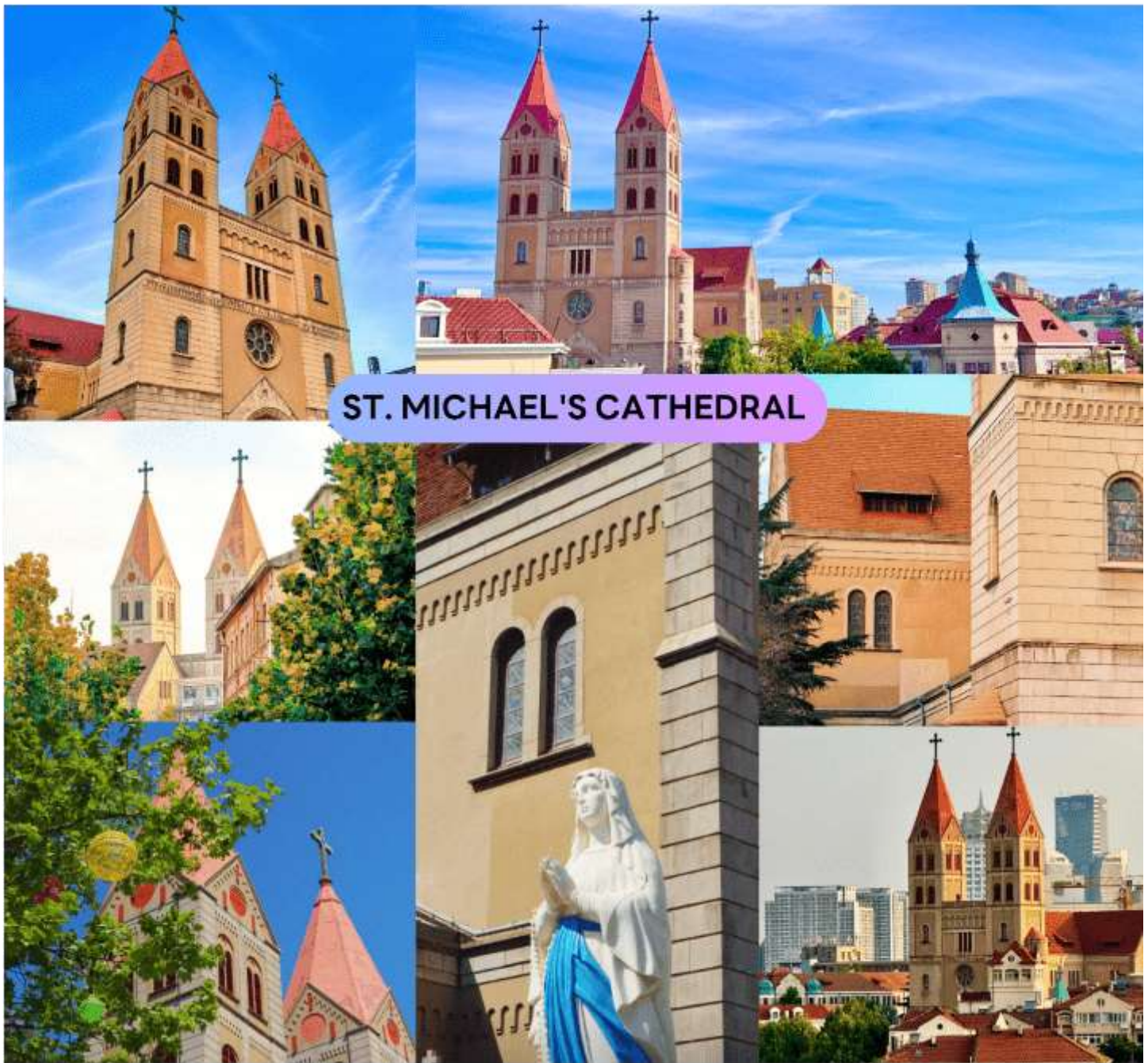
ST. MICHAEL'S CATHEDRAL

จากนั้นนำท่านสู่ ถนนจงซาน (Zhongshan Road) หนึ่งในย่านช้อปปิ้งเดินเล่นยอดนิยมของซิงเต่า ผสมผสานความทันสมัย และกลิ่นอายประวัติศาสตร์ได้อย่างลงตัว ถนนสายนี้เต็มไปด้วยร้านค้าแฟชั่น ร้านอาหาร คาเฟ่ ร้านของที่ระลึก ให้ผู้มาเยือนได้เลือกช้อปปิ้ง หรือสัมผัสวิถีชีวิตของชาวซิงเต่าอย่างใกล้ชิด ระหว่างเดินเล่นบนถนนจงซาน ท่านจะได้ชมสถาปัตยกรรมสไตล์ยุโรปแบบโคโลเนียลที่เรียงรายอย่างสวยงาม พร้อมเพลิดเพลินไปกับบรรยากาศตึกตักของผู้คน การผสมผสานระหว่างสถาปัตยกรรมคลาสสิก และความทันสมัยของร้านค้า ทำให้ที่นี่กลายเป็นจุดชมเมือง และถ่ายภาพยอดนิยม จึงเป็นแลนด์มาร์กสำคัญที่นักท่องเที่ยวไม่ควรพลาด หากต้องการสัมผัสทั้งวัฒนธรรม ช้อปปิ้ง และความตึกตักของเมืองซิงเต่า