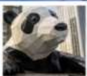
ห้าง IFS แพนด้าปิ่นตึก