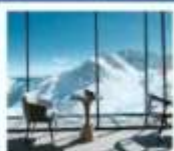
4860 COFFEE SHOP