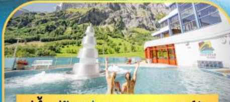
แช่น้ำแร่ร้อนผ่อนคลายลวยคอร์บิค