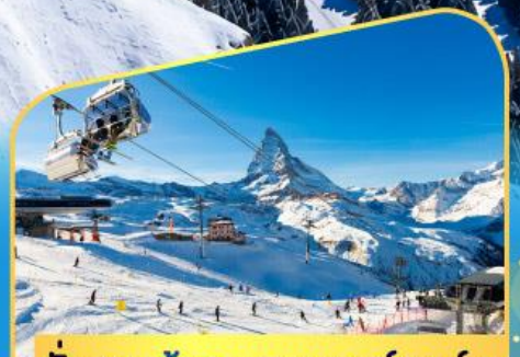
นั่งกระเช้าชมแมทเทอร์ฮอร์น