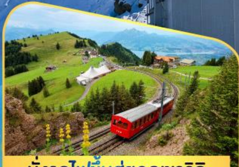
นั่งรถไฟขึ้นสู่ยอดเขาโรติก