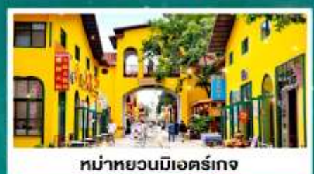
หมู่บ้านมื่อเออร์เกง