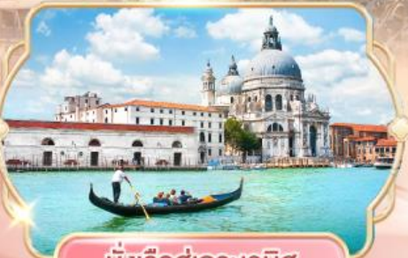
นั่งเรือสู่เกาะเวนิส