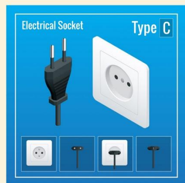
ปลั๊กไฟที่ใช้ที่อียิปต์