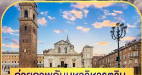
ถ่ายภาพกับมหาวิหารตูริน