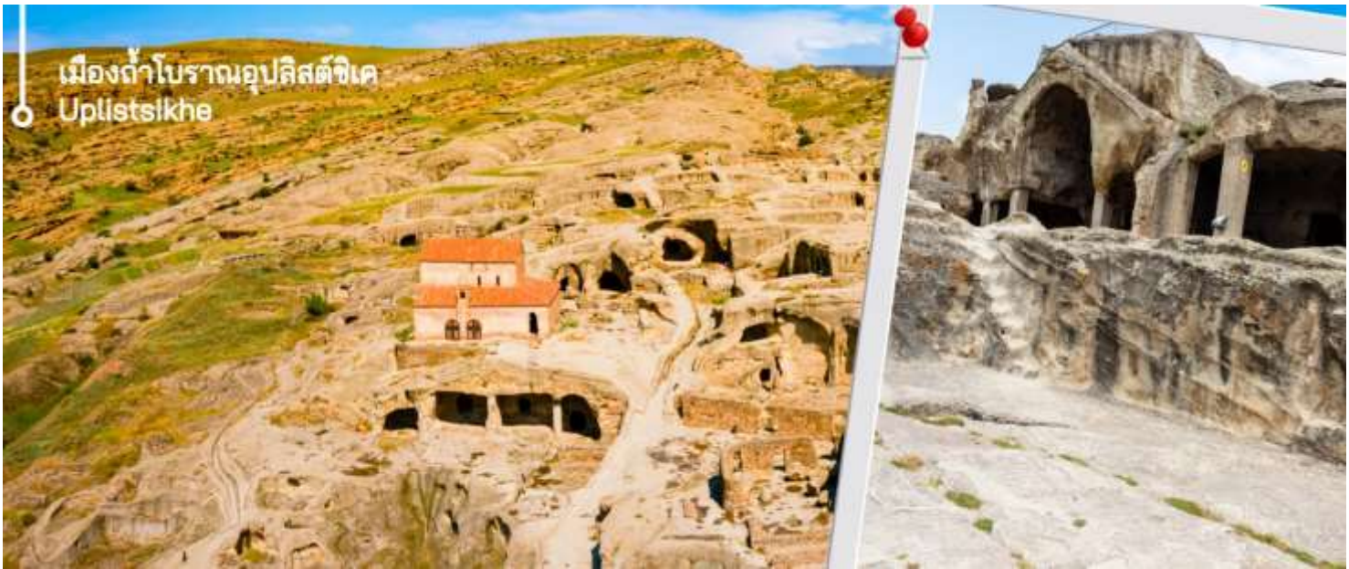
เมืองถ้ำโบราณอูปลิสต์ซิกเค Uplistsikhe

นำท่านเดินทางชมถ้ำโบราณ เมืองถ้ำโบราณอูปลิสต์ซิกเค ได้รับการระบุโดยนักโบราณคดีว่าเป็นหนึ่งในแหล่งที่อยู่อาศัยในเมืองที่เก่าแก่ที่สุดในจอร์เจีย ถ้ำส่วนใหญ่ไม่มีการตกแต่งใดๆ แม้ว่าโครงสร้างขนาดใหญ่บางแห่งจะมีเพดานโค้งแบบอุโมงค์ที่แกะสลักหินเลียนแบบท่อนซุง โครงสร้างขนาดใหญ่บางแห่งยังมีช่องเล็กๆ อยู่ด้านหลังหรือด้านข้าง ซึ่งอาจใช้สำหรับพิธีกรรม ด้านหน้าของห้องโถงพิธีกรรมขนาดใหญ่ทางตอนใต้ตกแต่งด้วยซุ้มโค้งแบบโรมันที่มีหน้าจั่ว มหาวิหารในศตวรรษที่ 6 ส่วนใหญ่แกะสลักเข้าไปในหิน ยกเว้นกำแพงด้านใต้ที่สร้างจากหิน ที่จุดสูงสุดของบริเวณนั้นมีมหาวิหาร คริสเตียน ที่สร้างด้วยหินและอิฐในศตวรรษที่ 9-10 การขุดค้นทางโบราณคดีได้ค้นพบสิ่งประดิษฐ์มากมายจากยุคต่างๆ รวมถึงเครื่องประดับทองคำ เงิน และทองสัมฤทธิ์ ตลอดจนตัวอย่างเครื่องปั้นดินเผาและประติมากรรม สิ่งประดิษฐ์เหล่านี้จำนวนมากได้รับการเก็บรักษาไว้ในพิพิธภัณฑ์แห่งชาติในกรุงทбилиซี