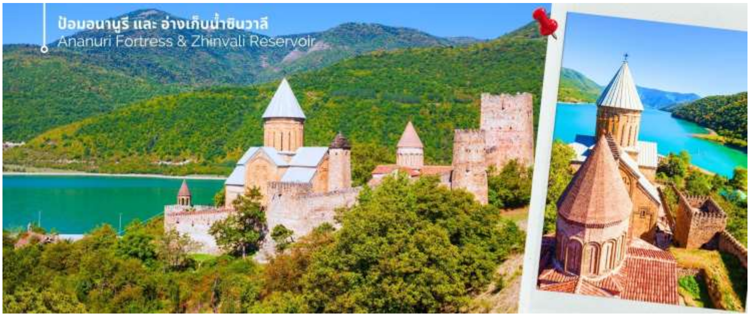
ป้อมอนาบุรี และ อ่างเก็บน้ำชินวาสิ Ananuri Fortress & Zhinvali Reservoir

จากนั้นนำท่านถ่ายภาพความงามของ อ่างเก็บน้ำชินวาสิ (Zhinvali Reservoir) เป็นอ่างเก็บน้ำที่สวยงามและมีชื่อเสียง สร้างขึ้นในปี 1986 ด้วยวัตถุประสงค์หลักเพื่อผลิตไฟฟ้าพลังน้ำและจัดสรรน้ำสำหรับการอุปโภคบริโภค โอบล้อมด้วยทิวทัศน์อันตระการตา ด้วยภูเขาและป่าไม้อันเขียวขจี และความหลากหลายทางธรรมชาติ