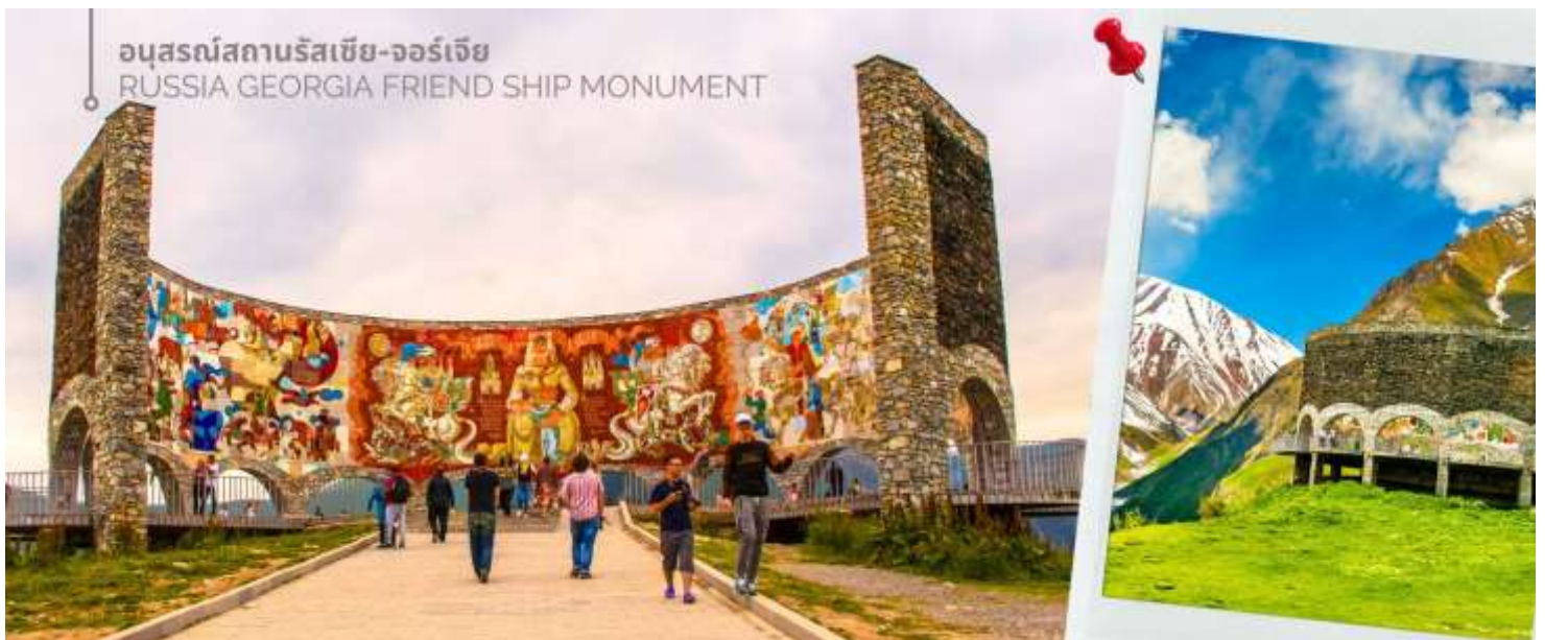
อนุสรณ์สถานรัสเซีย-จอร์เจีย RUSSIA GEORGIA FRIEND SHIP MONUMENT

จากนั้นนำท่านแวะถ่ายภาพและชมความงามของ อนุสรณ์สถานรัสเซีย-จอร์เจีย (RUSSIA GEORGIA FRIEND SHIP MONUMENT) เป็นอนุสรณ์หินคอนกรีตทรงกลมขนาดใหญ่ สร้างขึ้นในปี ค.ศ. 1983 เพื่อเฉลิมฉลองครบรอบ 200 ปีของสนธิสัญญาจอร์จีฟสกี (Treaty of Georgie ski) ซึ่งเป็นการแสดงถึงความสัมพันธ์อันดีระหว่างรัสเซียและจอร์เจียในช่วงเวลานั้น อนุสรณ์สถานนี้มี ความสูงประมาณ 20 เมตร และถูกออกแบบในสไตล์สถาปัตยกรรมโซเวียต ตัวอาคารมีรูปทรงกลมขนาดใหญ่ ภายในตกแต่งด้วยกระเบื้องโมเสกสีสันสดใส ซึ่งบอกเล่าเรื่องราวประวัติศาสตร์และวัฒนธรรมของทั้งสองชาติ ตั้งอยู่บนเส้นทางระหว่างเมืองกูตาอูรีและคาซเบกิ และทำเลบนยอดเขาสูง ทำให้เป็นจุดชมวิวที่สามารถมองเห็นทิวทัศน์อันงดงามของเทือกเขาคอเคซัสได้ ปัจจุบัน อนุสรณ์สถานแห่งนี้ยังคงตั้งอยู่ แต่ความหมายของมันได้เปลี่ยนแปลงไปอย่างสิ้นเชิง หลังจากการล่มสลายของสหภาพโซเวียต โดยเฉพาะอย่างยิ่งสงครามรัสเซีย-จอร์เจียในปี ค.ศ.2008 ทำให้ความสัมพันธ์ระหว่างสองประเทศตึงเครียดขึ้นอย่างมาก และส่งผลกระทบต่อความหมายของอนุสรณ์สถานแห่งนี้