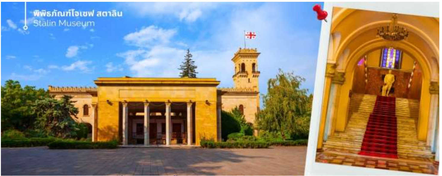
พิพิธภัณฑ์โจเซฟ สตาลิน Stalin Museum

นำท่านเดินทางชมถ้ำโบราณ เมืองถ้ำโบราณอูปลิสต์ซิกเค ได้รับการระบุโดยนักโบราณคดีว่าเป็นหนึ่งในแหล่งที่อยู่อาศัยในเมืองที่เก่าแก่ที่สุดในจอร์เจีย ถ้ำส่วนใหญ่ไม่มีการตกแต่งใดๆ แม้ว่าโครงสร้างขนาดใหญ่บางแห่งจะมีเพดานโค้งแบบอุโมงค์ที่แกะสลักหินเลียนแบบท่อนซุง โครงสร้างขนาดใหญ่บางแห่งยังมีช่องเล็กๆ อยู่ด้านหลังหรือด้านข้าง ซึ่งอาจใช้สำหรับพิธีกรรม ด้านหน้าของห้องโถงพิธีกรรมขนาดใหญ่ทางตอนใต้ตกแต่งด้วยซุ้มโค้งแบบโรมันที่มีหน้าจั่ว มหาวิหารในศตวรรษที่ 6 ส่วนใหญ่แกะสลักเข้าไปในหิน ยกเว้นกำแพงด้านใต้ที่สร้างจากหิน ที่จุดสูงสุดของบริเวณนั้นมีมหาวิหาร คริสเตียน ที่สร้างด้วยหินและอิฐในศตวรรษที่ 9-10 การขุดค้นทางโบราณคดีได้ค้นพบสิ่งประดิษฐ์มากมายจากยุคต่างๆ รวมถึงเครื่องประดับทองคำ เงิน และทองสัมฤทธิ์ ตลอดจนตัวอย่างเครื่องปั้นดินเผาและประติมากรรม สิ่งประดิษฐ์เหล่านี้จำนวนมากได้รับการเก็บรักษาไว้ในพิพิธภัณฑ์แห่งชาติในกรุงทбилиซี