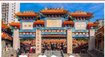
วัดเขว้งต้าเซียน