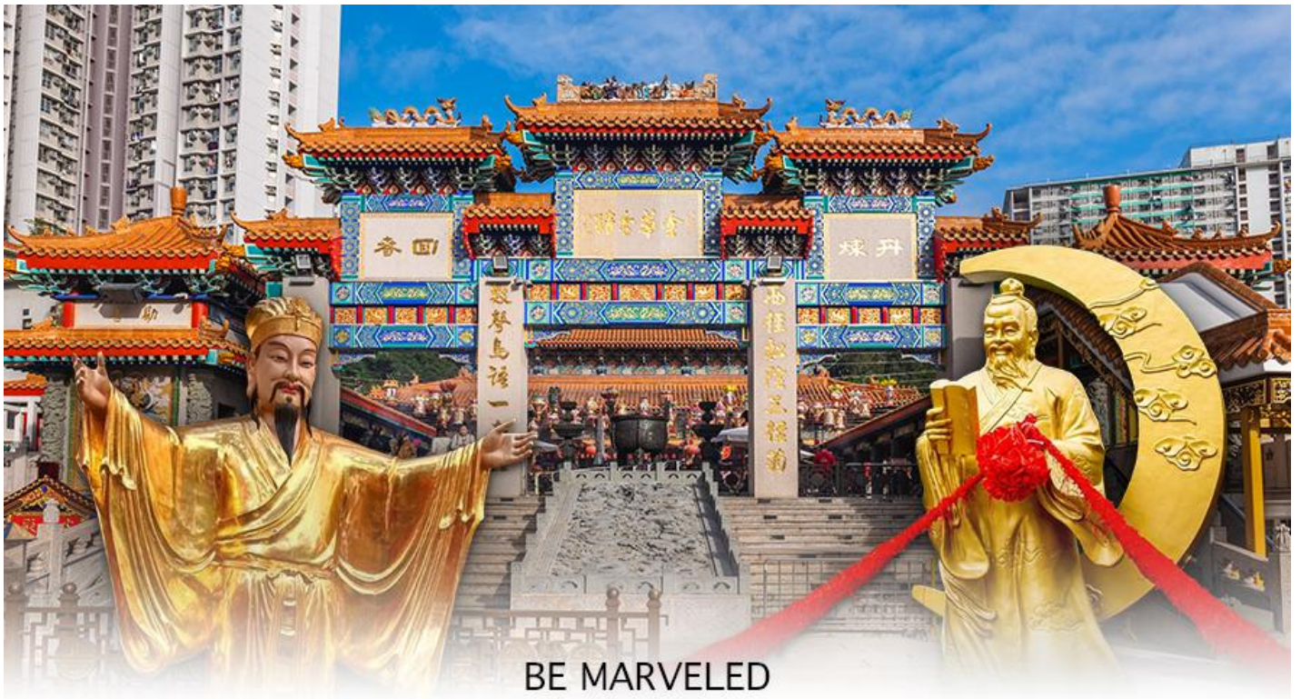
BE MARVELED วัดหว่องต้าเซียน

ให้ วัดหว่องไท่ซิน นั้น มีชื่อเสียงโด่งดังขึ้นมาเพราะ พระหวังต้าเซียน หรือที่รู้จักกันในชื่อ ฮวงซูปิง (Huang Chu-ping) ในช่วงประมาณศตวรรษที่ 4 ได้เดินทางจากเมืองจินมาเผยแผ่ศาสนาในฮ่องกง และสร้างวัดแห่งนี้ขึ้นมาเมื่อประมาณปีค.ศ. 1921 ค่ะ ภายในวัดจะมีทั้ง เทพเจ้าหวังต้าเซียน, เจ้าแม่กวนอิม, เจ้าที่, เทพเจ้าหยุกโหลว (เทพเจ้าแห่งความรัก), ท่านขงจื้อ ซึ่งคนฮ่องกงเอง และนักท่องเที่ยวก็จะมาราบไหว้เพื่อสิริมงคลกัน โดยเฉพาะอย่างยิ่งคือ เทพเจ้าหยุกโหลว หรือ เทพเจ้าแห่งความรัก ที่เราเรียกกันว่า เทพเจ้าด้ายแดง เป็นพิภคที่หลายๆ คนมักจะไปขอความรักจากท่านกัน นอกจากนี้เราจะต้องเอาด้ายแดงมาพันมือนิ้ว ตามป้ายที่แนะนำข้างหน้าแล้ว ใค้ นำเที่ยวคนฮ่องกงบอกว่าถ้าเป็นผู้หญิงอย่างเราอยากได้แฟน ก็ต้องไปผูกด้ายที่รูปปั้นผู้ชายและพอไหว้เสร็จแล้วก็อย่าลืมหยอดทำบุญใส่ตู้ไปด้วย