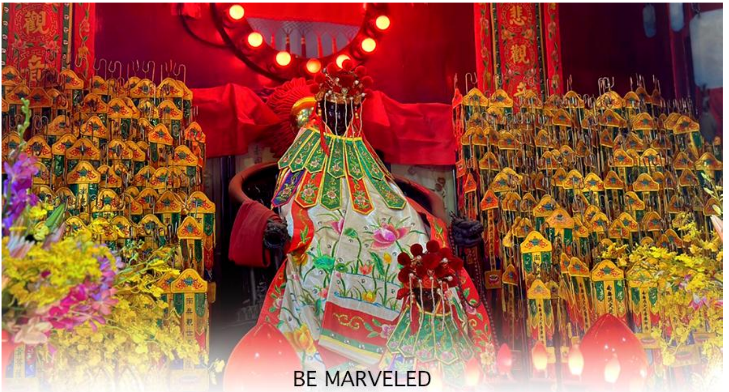
BE MARVELED วัดเจ้าแม่กวนอิมฮวงอ้า (ยิมฮิน)

ให้เดินทางกลับไปกราบไหว้ และขอบคุณเจ้าแม่กวนอิมอีกครั้ง โดยเตรียมชุดไหว้และกระดาษาเงินกระดาษาทองที่เป็นเหมือนเงินที่เรานำมาคืน เป็นการไหว้เพื่อคืนเงินเจ้าแม่กวนอิมนั่นเอง