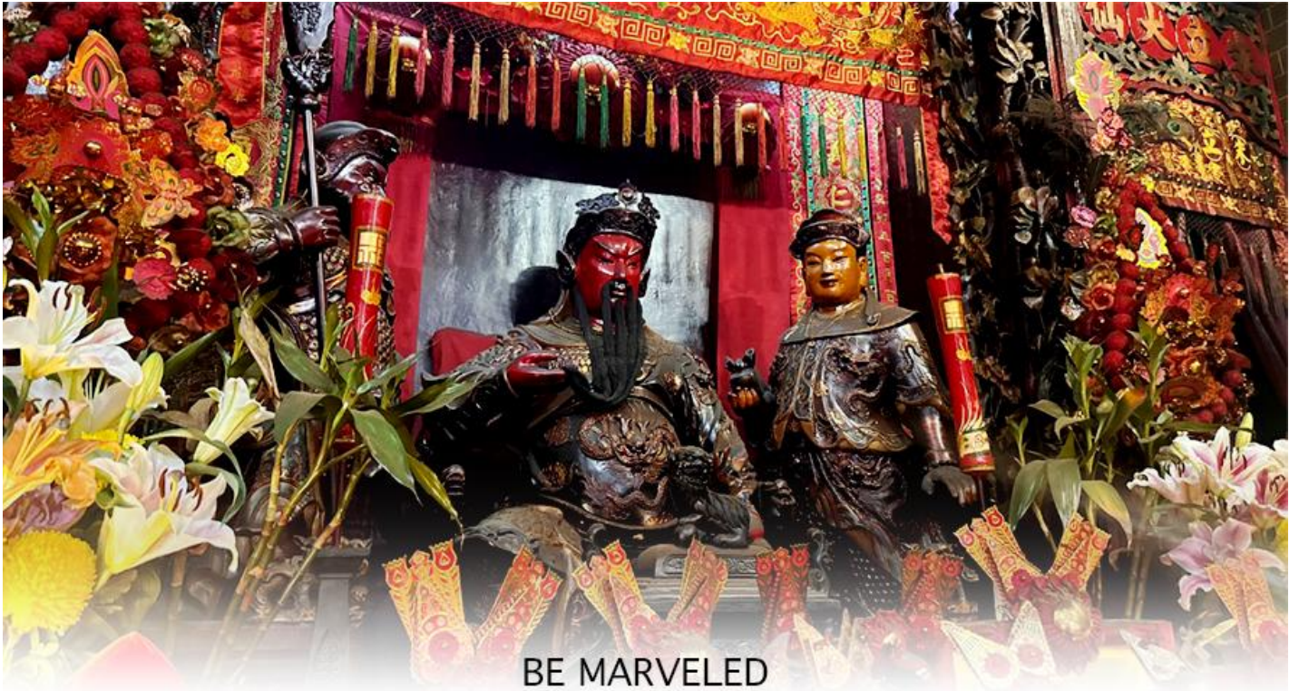
BE MARVELED วัดกวนอู

สัญลักษณ์แห่งความเข้มแข็งโดดเด่น ไม่ครั้นคร้ามต่อศัตรู ฉะนั้นการมาบูชาขอพรท่าน จะช่วยเสริมดวงไม่ให้ เปลืองพลั่วแก่ศัตรู ทำให้มีมิตรที่ซื่อสัตย์ และคุ้มครองบริวารให้ก้าวหน้าและอยู่เย็นเป็นสุข ซึ่งผู้ประกอบการอาชีพ ตำรวจ ทหาร และ นักการเมือง จึงมักจะนิยมบูชาเทพเจ้ากวนอู เป็นพิเศษ