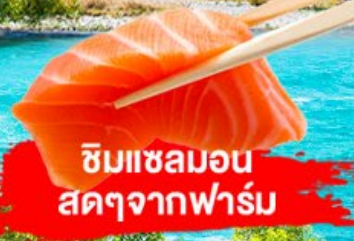
ชิมแซลมอน สดๆจากฟาร์ม