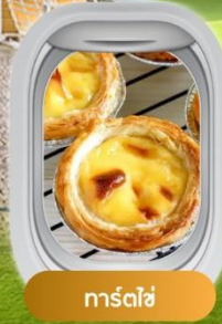
ทาร์ตไข่