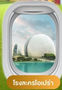
โรงละครโอเปร่า