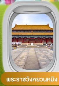
พระราชวังหยวนหมิง