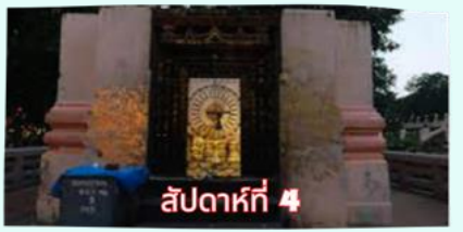
รัตนขรเจดีย์ (ซุ้มเรือนแก้ว)

เรียบร้อยแล้ว นำคณะจาริกบุญสวดมนต์ทำวัตรเย็น บูชาพระรัตนตรัย และสวดมนต์บูชาสังเวชนียสถาน จากนั้นเชิญท่านทัศนารธรรม นั่งสมาธิปฏิบัติบูชาตามอธยาศัย สมควรแก่เวลา นัดหมายเวลาเชิญท่านกลับโรงแรมที่พัก