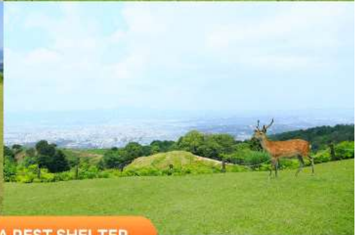
MT. WAKAKUSA REST SHELTER