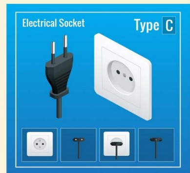
ปลั๊กไฟที่ใช้ที่อียิปต์