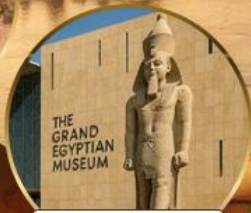
พิพิธภัณฑ์แกรนด์อียิปต์