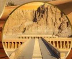
หุบเขากษัตริย์