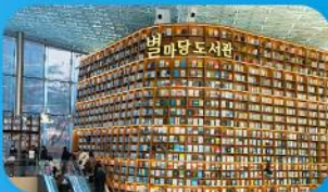
ห้องสมุดสตาร์ฟิลา