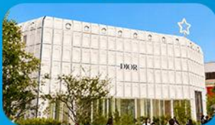
บรักคินกาซึ