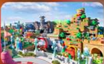
อิสระท่องเที่ยว