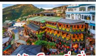
หมู่บ้านโบราณจีวเฟิ่น