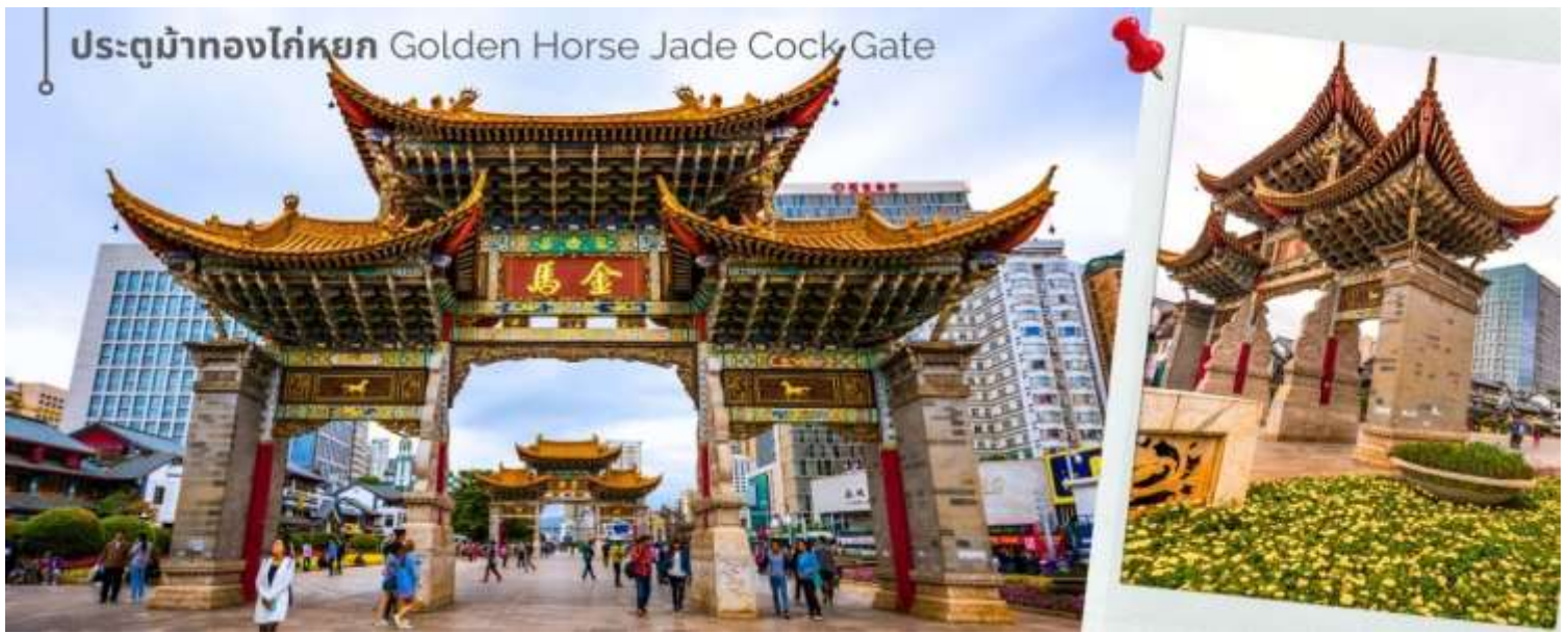
ประตูม้าทองโก่หยก Golden Horse Jade Cock Gate

ค่ำ 10! รับประทานอาหารค่ำที่ภัตตาคาร (14)