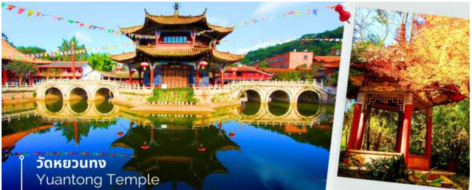
วัดหยวนทอง Yuantong Temple

นำท่านชม วัดหยวนทอง (Yuantong Temple) วัดแห่งนี้เป็นวัดที่ใหญ่และเก่าแก่ที่สุดในเมืองคุนหมิง สร้างมาตั้งแต่สมัยราชวงศ์ถัง มีอายุยาวนานประมาณ 1,200 กว่าปี การสร้างวัดแห่งนี้จะแปลกตากว่าวัดอื่นในจีน เพราะปกติแล้วการสร้างวัดของจีนส่วนมากจะต้องสร้างอยู่บนภูเขา แต่วัดหยวนทองสร้างวัดต่ำกว่าภูเขา โดยวิหารจะอยู่ต่ำที่สุดเนื่องจากวัดแห่งนี้ไม่ได้สร้างขึ้นเพื่อเป็นวัดโดยตรง แต่เคยเป็นศาลเจ้าแม่กวนอิมมาก่อน