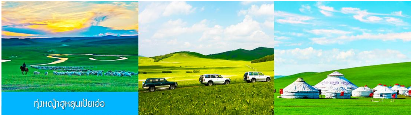
ทุ่งหญ้าฮูลุนเปียวเอ๋อ