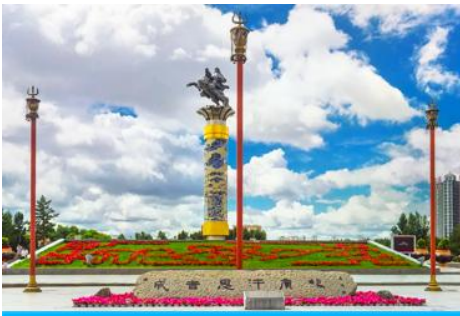
จัตุรัสวงกิสข่าน

หลังอาหารนำท่านเดินทางสู่เมือง ไห่ลาเอ๋อ 海拉尔市 (ระยะทาง 456 กม. ใช้เวลาเดินทางราว 5 ชั่วโมงครึ่ง)