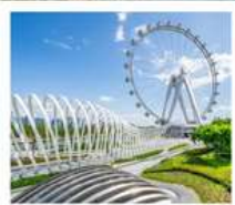
สวนสาธารณะ: OH BAY