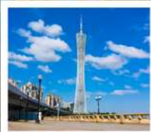
จัตุรัสฮิวอิง