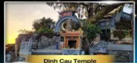
Dinh Cau Temple