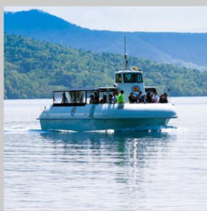
“LAKE SHIKOTSU GLASS BOAT”