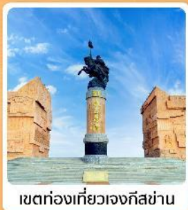
เขตท่องเที่ยวเจงกิสข่าน