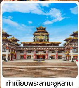
ทำเนียบพระลามะอูหลาน