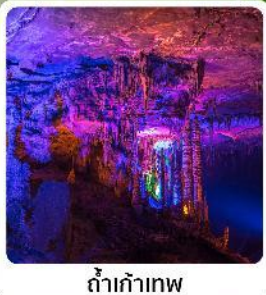
ดำเก้าทพ