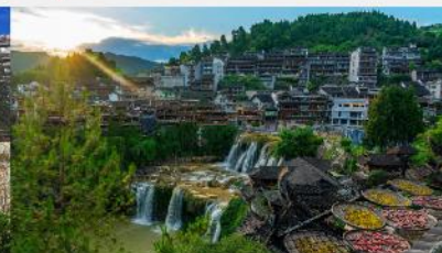
หมู่บ้านโบราณฝูหรงเจิ้น

*ทางบริษัทฯ ขอสงวนสิทธิ์ในการสลับโปรแกรมทัวร์ตามความเหมาะสมขึ้นอยู่กับสถานการณ์หน้างาน โดยคำนึงถึงผลประโยชน์ของลูกค้าเป็นสำคัญ