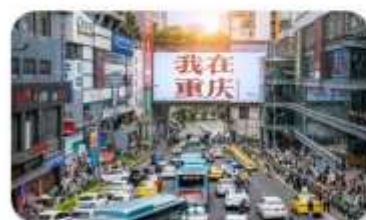
ถนนอาหารถวนอันเฉียว