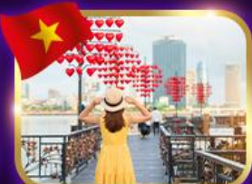
เช็किनสะพานแห่งความรัก