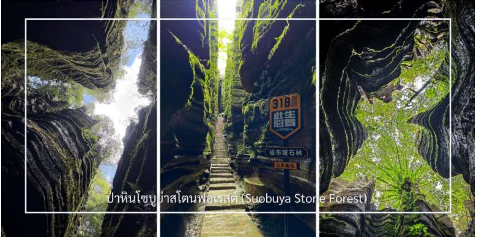
ป่าหินโซบูย่าสโตนฟอเรสต์ (Suobuya Stone Forest)

หลังอาหารเช้านำท่านสู่ ป่าหินโซบูย่าสโตนฟอเรสต์ (Suobuya Stone Forest) แหล่งท่องเที่ยวทางธรรมชาติอันน่ามหัศจรรย์ ซึ่งโดดเด่นด้วยกลุ่มหินปูนรูปร่างแปลกตาที่ก่อตัวขึ้นตามธรรมชาติเป็นเวลานับล้านปี ภายในพื้นที่เต็มไปด้วยเสาหินสูงตระหง่านเรียงรายสลัซับซ้อน เปรียบเสมือนป่าที่สร้างขึ้นจากหิน ผสานกับบรรยากาศร่มรื่นและเงียบสงบ เหมาะแก่การเดินทางชมธรรมชาติและเก็บภาพความประทับใจตลอดเส้นทาง