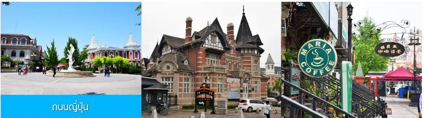
ถนนญี่ปุ่น