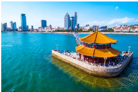
สะพานเทียนเจียว