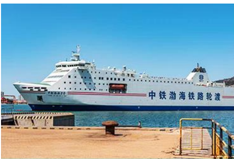
เรือ ZHONGTIE BOHAI CRUISE