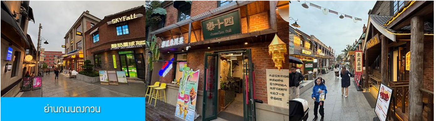
ย่านถนนตงกวน

นำท่านเที่ยวชม จัตุรัสชิงไห่ 星海广场 เป็นจัตุรัสขนาดใหญ่เป็นแลนด์มาร์คสำคัญของเมืองต้าเหลียน สร้างขึ้นเพื่อเฉลิมฉลองในโอกาสที่รัฐบาลอังกฤษคืนเกาะฮ่องกงในให้จีนในปี ค.ศ. 1997 ตั้งอยู่ชายฝั่งทะเลในเมืองต้าเหลียน เป็นจัตุรัสใจกลางเมืองที่ใหญ่ที่สุดในโลกและ เป็นแลนด์มาร์คของเมืองต้าเหลียน รายล้อมด้วยตึกกระจาที่ทันสมัย ภายในมีบ่อน้ำพุดนตรี ลานหญ้าขนาดใหญ่ และลานกว้างสำหรับจัดกิจกรรมกลางแจ้ง อาทิ เทศกาลเบียร์นานาชาติ การแข่งขันวิ่งมาราธอน งานแฟชั่นนานาชาติเมืองต้าเหลียน ฯลฯ