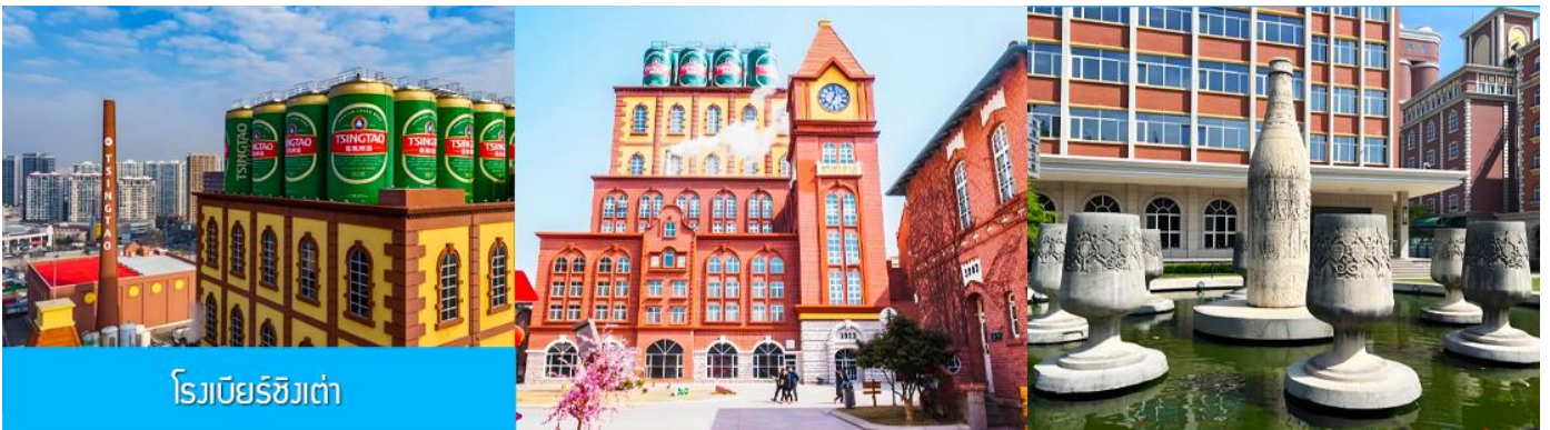
โรงเบียร์ชิงเต่า

เที่ยง รับประทานอาหารกลางวัน ณ ภัตตาคาร *เมนูซีฟู้ด (2)