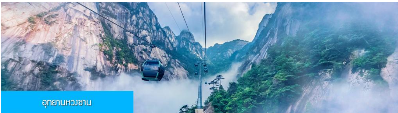
อุทยานหวงซาน