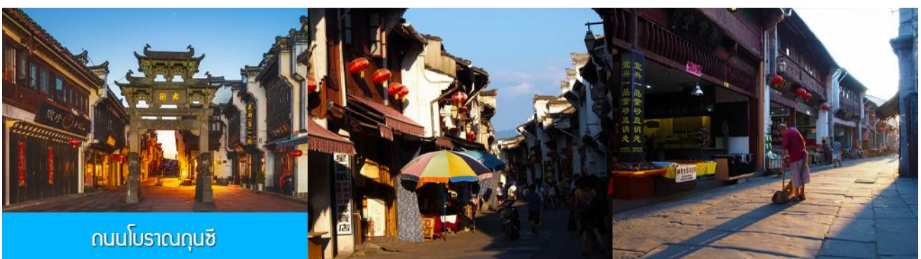
ถนนโบราณฉุนซี

อิสระอาหารมื้อกลางวัน ( ท่านสามารถเลือกชิมอาหารพื้นเมืองในระแวกโรงแรมได้ตามอัชชาศัย )