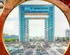
ประตูแห่งความสุข