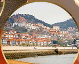
ซาจื่อเป่