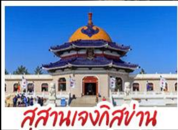
สุสานเจกิสซ่าน